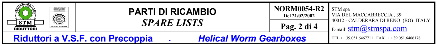
TAB.1 (CON RIFERIMENTO A FIG.1)